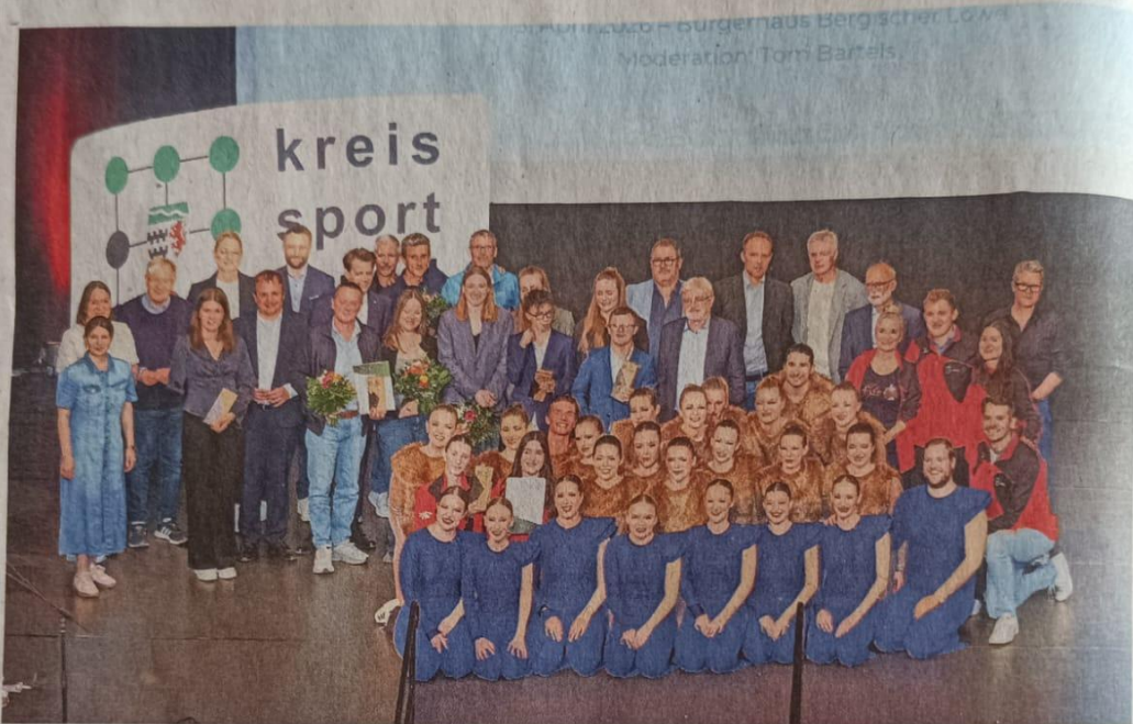
Geehrte Sportler*innen und Teams mit Vertreter*innen aus Politik, Kreis und Stadt.

Betreuer*innen, Sportler*innen und Mannschaften ausgezeichnet