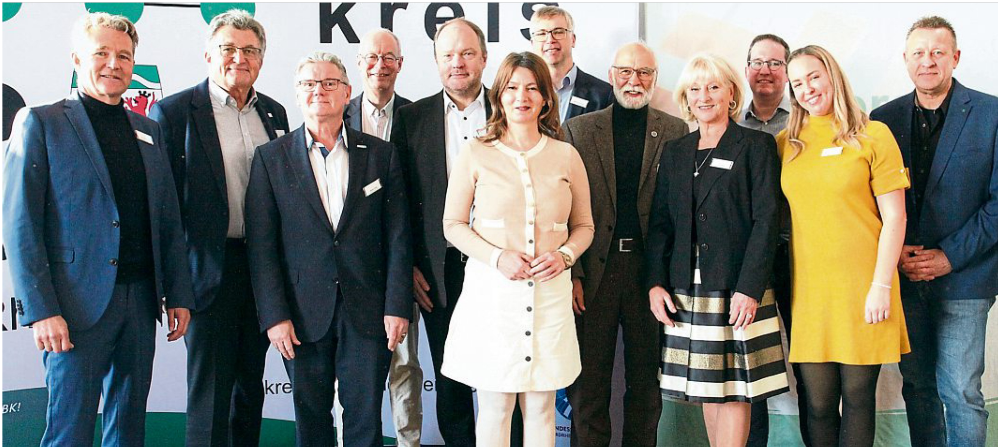
Vertretungen aus Politik und Sport beim Neujahrsempfang.