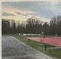
Die Skateranlage im Hagen (im Hintergrund) ist da, ein paar Plätze renoviert. Die asphaltierte Fläche links soll auch noch umgebaut werden.

Ruhe- und Schattenbereich mit Sitzbänken entstehen, der als Außenklassenzimmer dienen könnte. Platz wäre dort außerdem für eine ebenfalls beschattete Spielfläche.