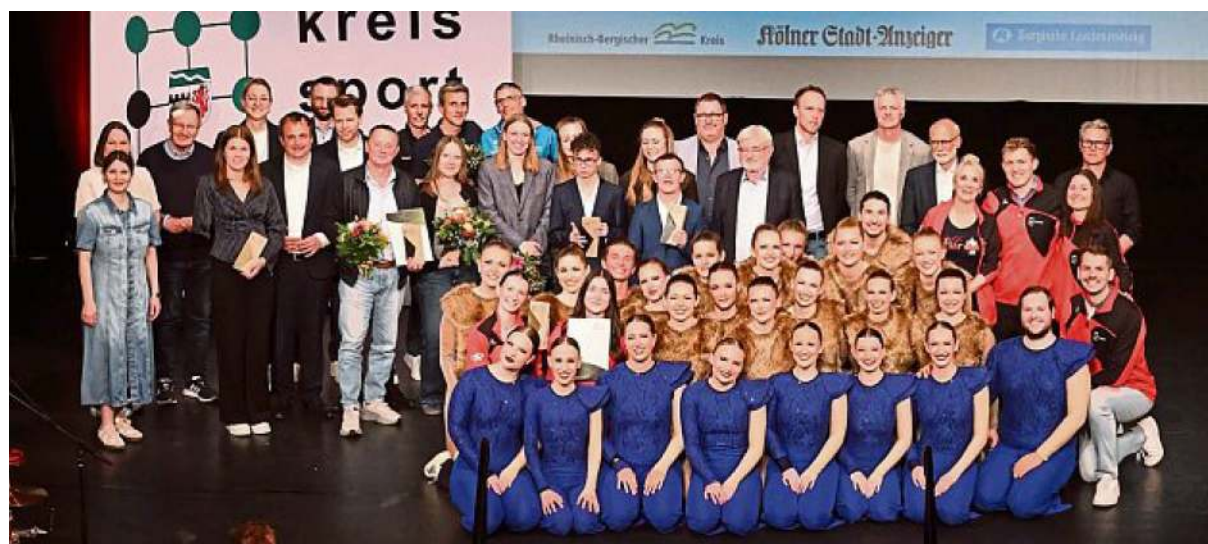
Die Sieger mit Laudatoren, Landrat und Vertretern von Kreissportbund und Partnern der Sportlerwahl und -erhebung.