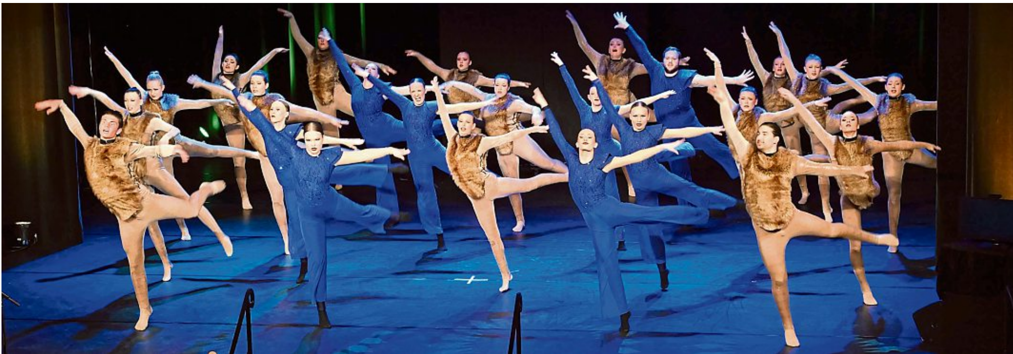
2025 wurden sie Weltmeister, jetzt Mannschaft des Jahres bei der Sportlerwahl in Rhein-Berg: Die Jazz Lights aus Bergisch Gladbach brillierten auch bei der Ehrungsgala.