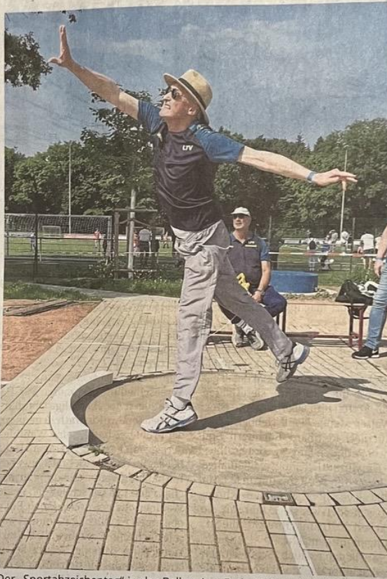
Der „Sportabzeichentag“ in der Balkler Aue Ende Mai trägt Früchte: Im Vergleich zu 2024 wurden im vergangenen Jahr 99 Abzeichen mehr in Leichlingen vergeben.

Vogel leistete noch einen weiteren Beitrag zum Sportabzeichen-Abschneiden Leichlingens: Gemeinsam mit seinem Schwieger-