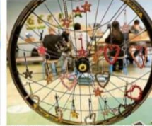
Eine Woche der Vielfalt: Der Jahrgang 9 hat Schlüsselanhänger aus Fahrlöh gefertigt.

ten zusammengebracht, die nach und nach zu den Bildern auf dem Schulgelände aufgetragen wurden. In einem anderen Klassenzimmer stehen mehrere Stellwände mit von den Kindern und Jugendlichen selbst geschossenen Fotos – entstanden im Workshop „Im Fokus deiner Linse“. Die Bilder sollen im Rahmen des Tages der Offenen Tür im November ausgestellt werden. Hierfürs beständiger ist die „Jugendliche“, bei der die Kinder Plakate zu Umweltthemen zum Sprechen gebracht haben: per Handy, Laptop und eingepreisten Texten.