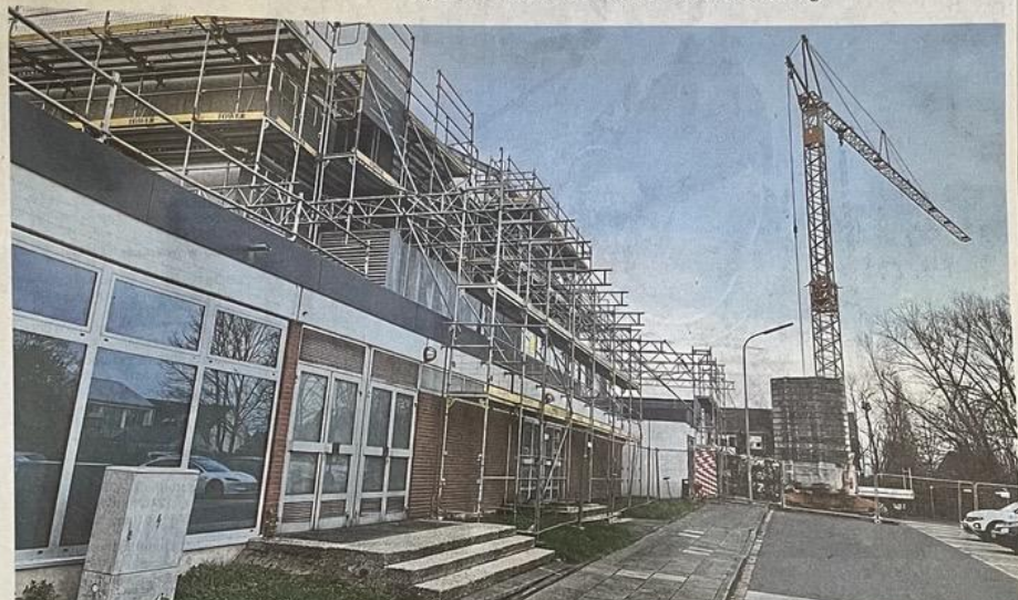
An der Max-Siebold-Halle in Hilgen wird schon heftig gearbeitet. Für eine Komplettierung fehlt bisher aber das Geld.

Der in Berlin formulierte Förderzweck „passt sehr genau“ zu den seit dem Jahr 2020 weit fortgeschrittenen Planungen zur Umgestaltung der Sportanlage im Hagen, heißt es aus dem Rathaus. Die neue Skateranlage, den Umbau der früheren Tennis-Leichtathletikflächen und die Sanierung eines Kunststoff-Kleinspielfelds hatte die EU mitbezahlt. Was nun noch mit Unterstützung aus Berlin ansteht, ist die Verwandlung der Asphaltspielfläche in eine 70-Meter-Laufbahn und eine Weitsprunganlage und die Sanierung des zweiten Kunststoff-Kleinspielfelds sowie des Gehwegs. Neben den neuen Leichtathletik-Anlagen soll ein