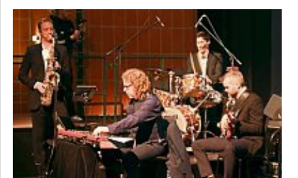
Begleiteten die Athleten musikalisch auf die Bühne: die „Sportophonics“.

Von den Treppchenplatz-Siegerinnen und -Siegern wurden zudem Videos eingespielt, die erstmals Krischan Lohmar für die Sportlererhebung erstellt hatte. (wg)