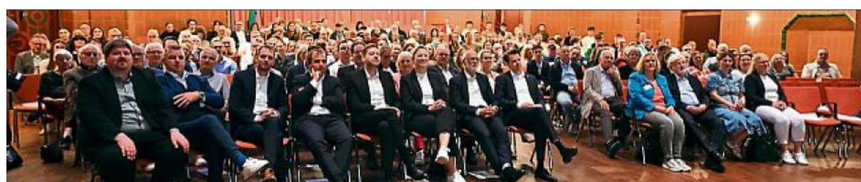
Gespannt verfolgten die Gäste der Sportlergala die Bekanntgabe der Platzierungen der Sportlerwahl.