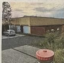
Die Dreifachhalle auf dem Schulberg neben der Johannes-Löh-Schule könnte eine Sanierung mehr als gut gebrauchen.