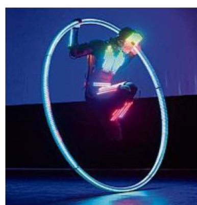
Mit LED-Leuchten an Körper und Reifen: Artist Boy faszinierte.