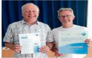
Eine Urkunde gab es für den TV Blecher.

Der Vereinsvorstand entschloss sich bereits vor über zwei Jahren dazu, ein umfassendes Schutzkonzept zu entwickeln. Die Arbeit erfolgte in einer vereinsinternen Arbeitsgruppe bestehend aus Vorstandsmitgliedern, einer Übungsleitung und engagierten Mitgliedern. Mit der Zeit entstand ein